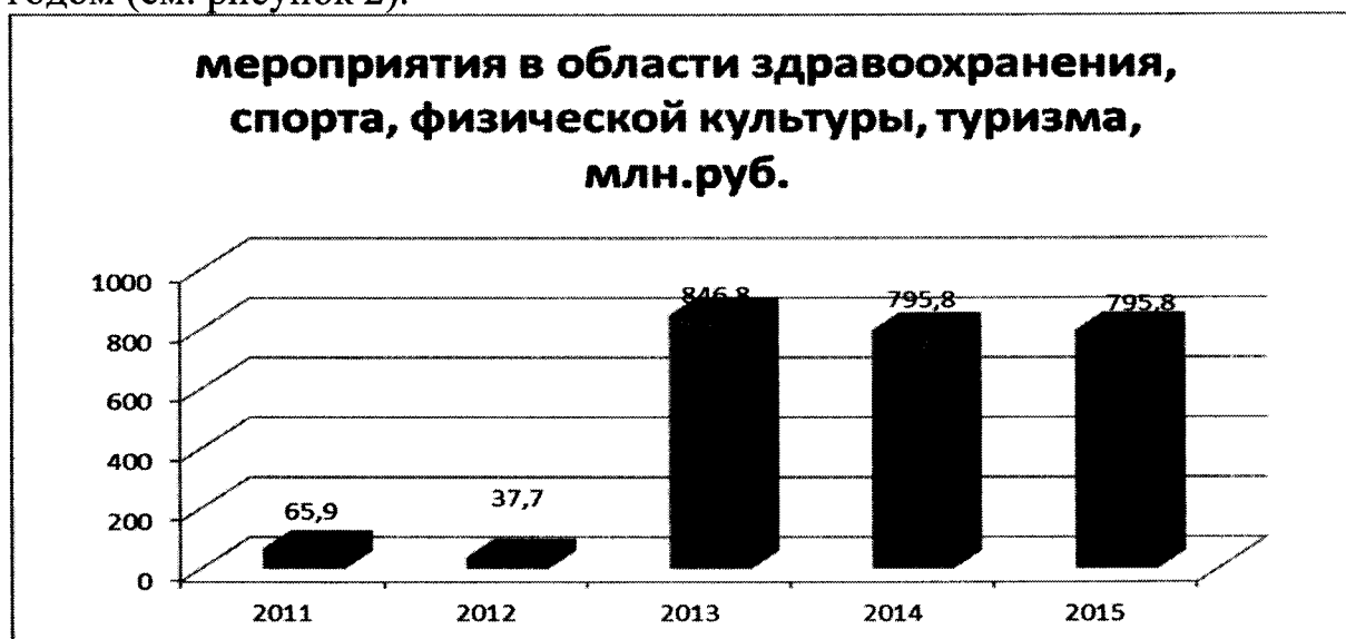
Рисунок 2 Динамика расходов по целевой статье 485 97 00 «Мероприятия в области здравоохранения, спорта и физической культуры, туризма»

Министерством здравоохранения Архангельской области, по запросу контрольно-счетной палаты Архангельской области, представлена расшифровка предлагаемых к утверждению бюджетных ассигнований по целевой статье 485 97 00, из которой следует, что по данной целевой статье, на 2013 год утверждено 29 мероприятий, из них: